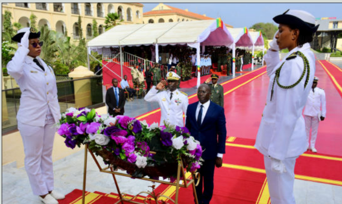
VISITE DE CONTACT DU MINISTRE DES FORCES ARMÉES A L'ÉTAT-MAJOR GÉNÉRAL DES ARMÉES