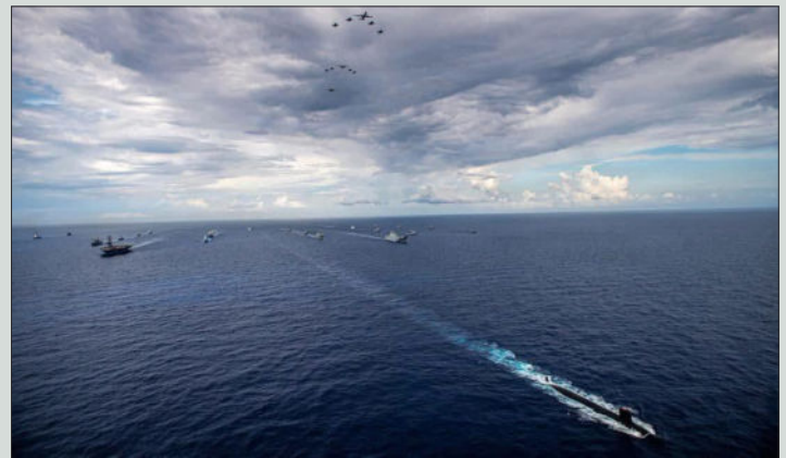
PARTICIPATION DE LA MARINE SÉNÉGAISE À L'EXERCICE INTERNATIONAL « FLEET EXERCISE 250 » AUX ÉTATS-UNIS