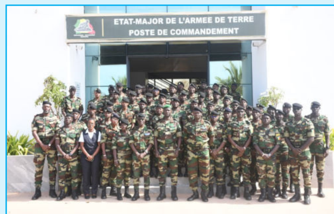
VISITE DE PRISE DE CONTACT DU CEMGA : LE VICE-AMIRAL D'ESCADRE, OUMAR WADE DÉBUTE PAR LES ÉTATS-MAJORS D'ARMÉE ET LA ZONE MILITAIRE N°7