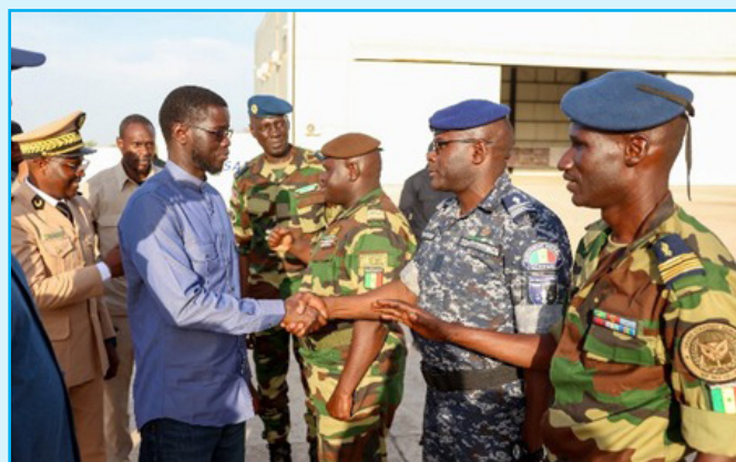
VISITE DU PRÉSIDENT DE LA RÉPUBLIQUE À LA BASE AÉRIENNE DE TAMBACOUNDA