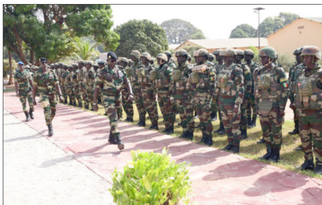
Zone militaire n°5, le 13 janvier 2026