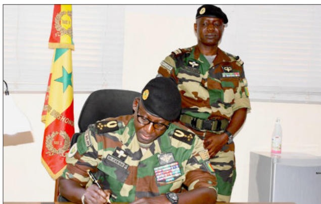
Zone militaire n°3, le 8 janvier 2026