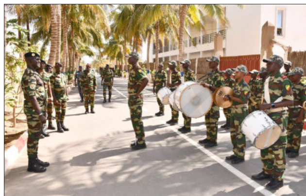
Zone militaire n°2, le 14 janvier 2026