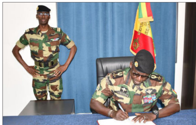
Zone militaire n°1, le 27 janvier 2026