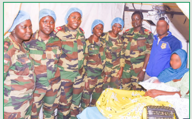
L'HÔPITAL MILITAIRE DE CAMPAGNE AU SECOURS DES POPULATIONS DE GOUDOMP