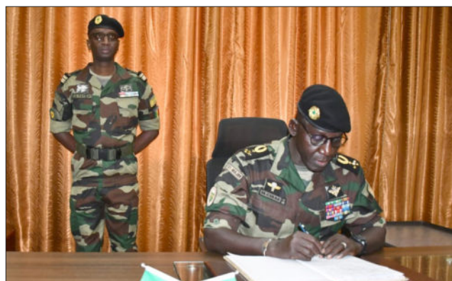
Zone militaire n°7, le 9 janvier 2026