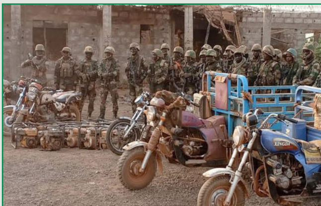
ZONE MILITAIRE N°4 : DÉMANTÈLEMENT DE SITES D'ORPAILLAGE CLANDESTIN LE LONG DE LA LIGNE FRONTALIÈRE