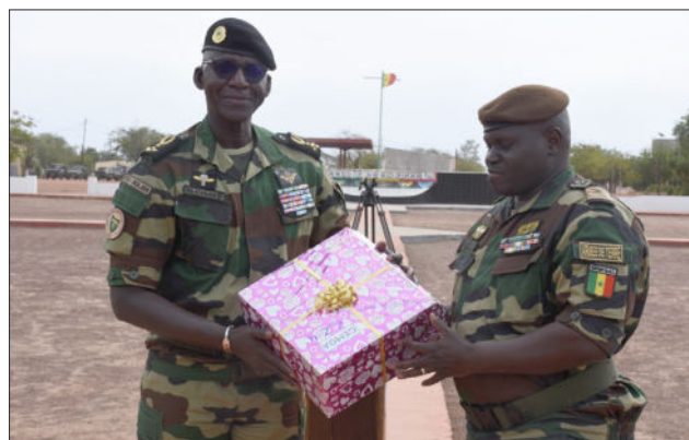
Zone militaire n°4, le 6 janvier 2026