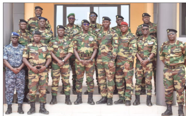
Zone militaire n°6, le 6 janvier 2026