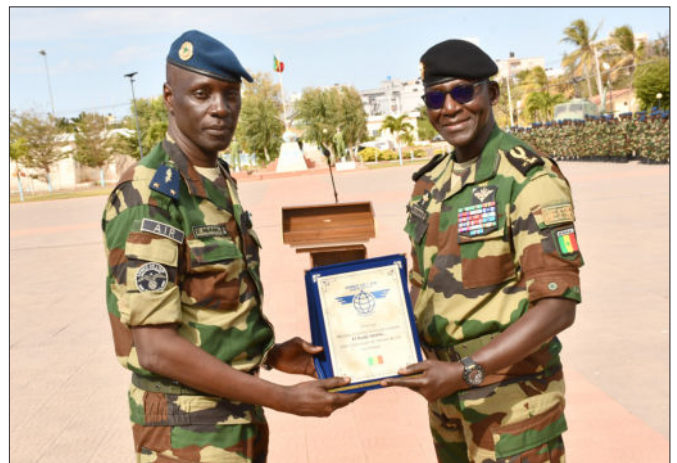
EMAIR, le 7 janvier 2026