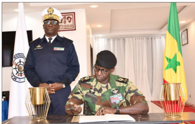
EMMARINE , le 7 janvier 2026