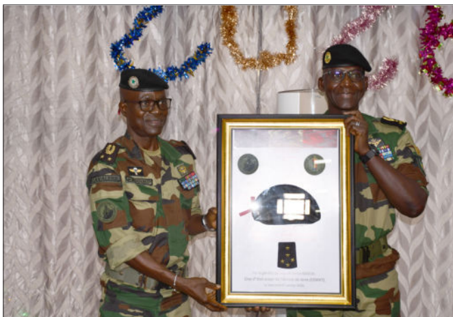
EMAT, le 7 janvier 2026

des traditions militaires et permettent au CEMGA de s'adresser pour une dernière fois aux troupes. Elles constituent également une occasion pour le CEMGA de visiter les chantiers en cours et d'inaugurer les infrastructures dont les travaux sont achevés.